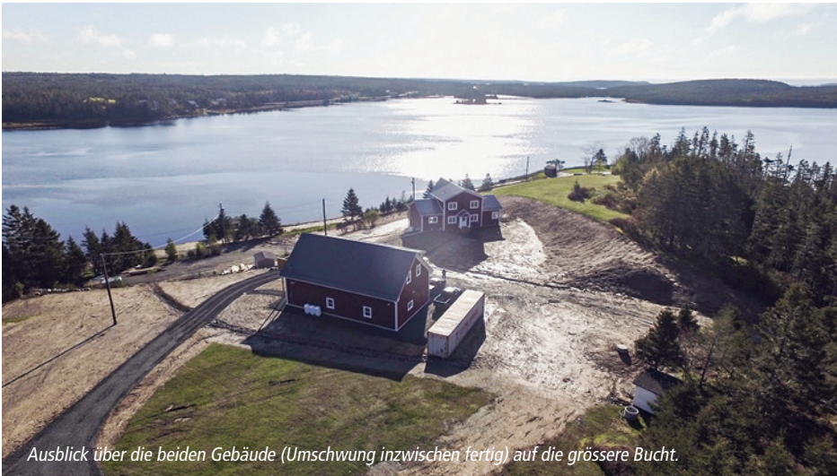
Ausblick über die beiden Gebäude (Umschwung inzwischen fertig) auf die grössere Bucht.