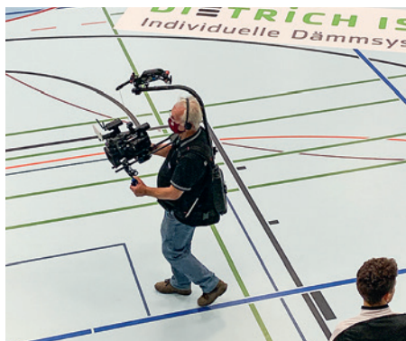
Hoch professionelle Wacker TV Handkamera.