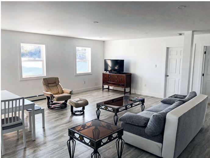
Wohnzimmer der Ferienwohnung.