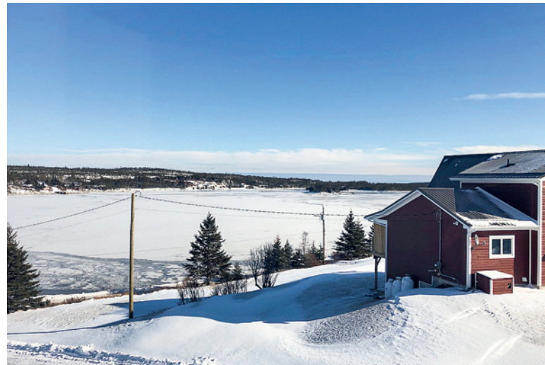
Winteraussicht aus der Ferienwohnung auf die zugefrorene Bucht.