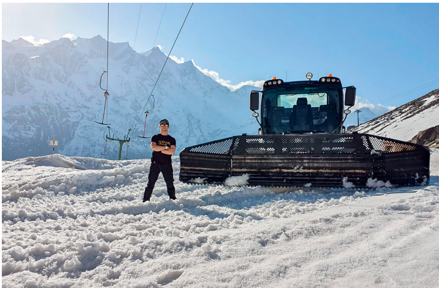
Atze als stolzer Pisten-Bully-Fahrer im Wallis.