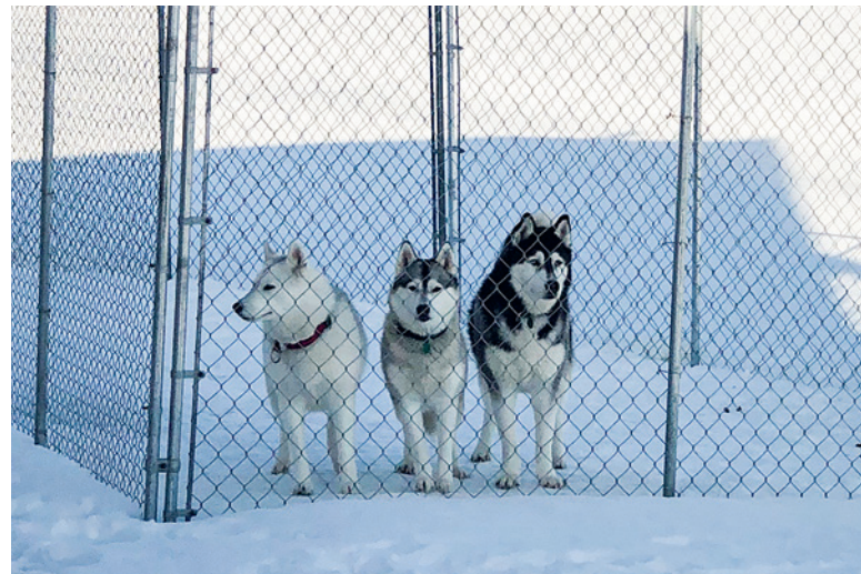
Grace, Hally und Gismo (v.l.n.r) – die drei Huskys in ihrem Element.